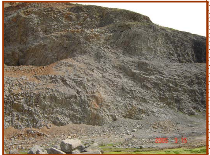
CARRIERE DE PRODUCTION D'AGREGATS "EL-MILIA"