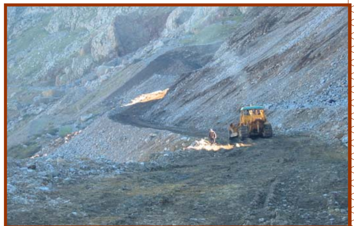
CARRIERE DE PRODUCTION D'AGREGATS "SIDI-MAAROUF"